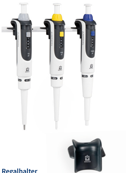
Regalhalter für 1 Transferpette® S Ein- oder Mehrkanalpipette.

Mit den Haltern und Ständern sind die Geräte immer fachgerecht aufbewahrt und griffbereit für den nächsten Einsatz.