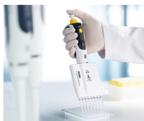
Arbeiten mit PCR-Platten