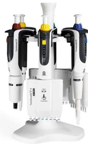
Tischständer Tischständer für 6 Transferpette® S Ein- oder Mehrkanalpipetten.