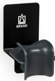
Wandhalter für 1 Transferpette® S Ein- oder Mehrkanalpipette.