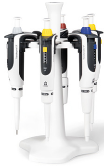
Abb. Pipetten-Paket 2